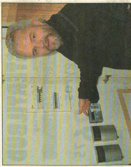
Alle og enhver kan bo i Thyholmhusene - varmeforbruget bliver styret over EDB.